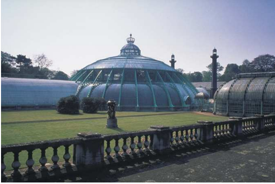
Die Königlichen Gewächshäuser

verdankt seinen Namen der ursprünglichen Absicht, dort Pflanzen aus der damaligen Kolonie Kongo zu pflanzen. Dieser Versuch scheiterte jedoch, stattdessen erwarten den Besucher tropische Gewächse wie zum Beispiel ein Gummibaum, der hier eine Höhe von 6 Metern erreicht.