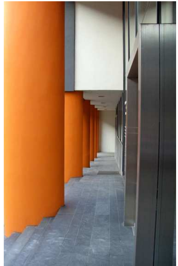
Säulengang zum Hauptportal der Belgischen Botschaft

Die Frühlingsausgabe von Nachbar Belgien, die Sie jetzt vor sich haben (bzw. in den Händen halten), legt die Beweise auf den Tisch: nicht nur in der plastischen Kunst, auf der Bühne, in der Literatur und in der Welt des Designs, sondern auch im sportlichen und medizinischen Bereich machen belgische Mitbürger international von sich reden. Ist es nicht verblüffend, dass ein Belgier an der Geburt der Anti-Babypille beteiligt war? Und dass Kim Clijsters jetzt abhebt (jedoch im positiven Sinne). Ob man das einen Volley nennen kann? Auf wirtschaftlichem Gebiet bleiben wir jedenfalls unternehmerisch, erst recht was die Vermarktung unseres berühmtesten Produkts angeht: nämlich der Schokolade. Auch auf politischem Gebiet sind wir unnachahmbar, darüber gab und gibt es jedoch anderswo schon genug zu lesen und hören. Aber zum Glück bleiben wir immer schön bescheiden... Es ist Frühling!