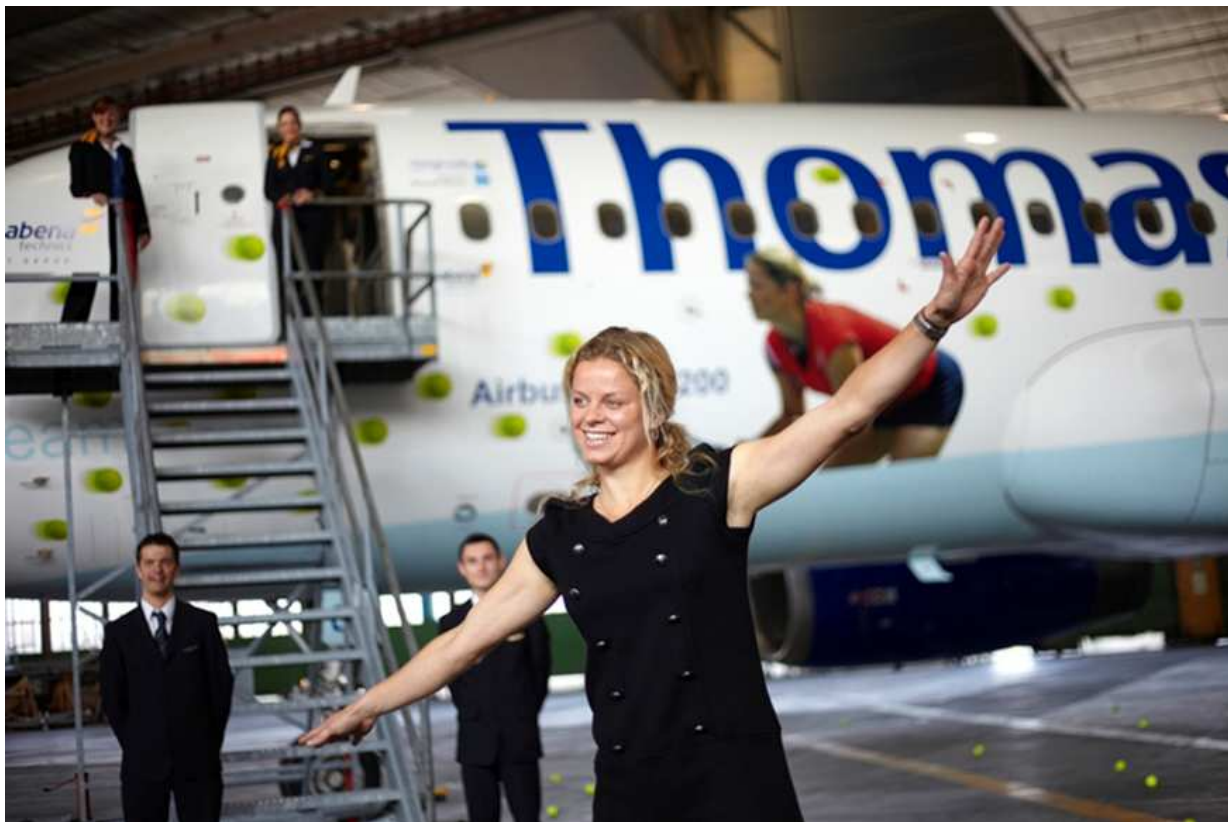
Kim Clijsters bei der Präsentation des Flugzeugs

Denken Sie nicht, dass Sie träumen, wenn sie auf einem Flugzeug der Charterfluggesellschaft „Thomas Cook Airlines Belgium“ ein Bildnis des belgischen Tennisprofis Kim Clijsters zu erkennen glauben. Dieser Reiseveranstalter hat nämlich