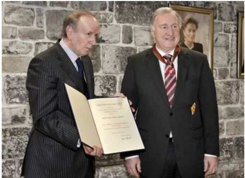
Botschafter Bettzuege und Ministerpräsident Lambertz