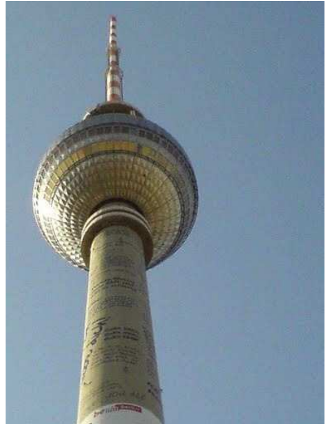
Der 368 Meter hohe Fernsehturm am Alexanderplatz

Seit der Wiedervereinigung ist der Fernsehturm, der wie kein anderes Bauwerk die Silhouette der Stadt prägt, zu einem Wahrzeichen für ganz Berlin geworden. 2002 übernahm die Deutsche Funkturm GmbH, eine Tochter der deutschen Telekom, das denkmalgeschützte Gebäude. Diese ließ es für 37 Millionen Euro sanieren, wobei auch die Antennenspitze ausgetauscht wurde und der ursprünglich 365 Meter hohe Turm noch drei Meter höher wurde. Von hier aus werden 31 Fernseh- und mehrere Dutzend UKW-, Mobilfunk- und Richtfunkprogramme ausgestrahlt.