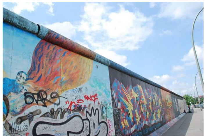
East Side Gallery

Ob die belgische Comicfigur Gaston Lagaffe von Franquin, die auf dem ursprünglichen Mauerstück zu sehen war, auch wieder auftaucht, konnte NB noch nicht in Erfahrung bringen.