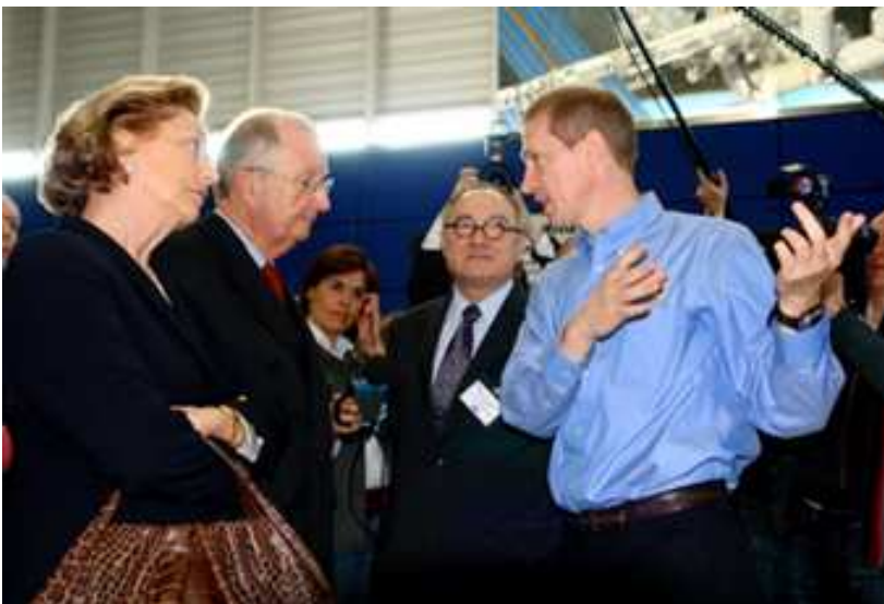
Frank De Winne mit dem belgischen Königspaar im EAC Köln

Wie NB bereits schrieb, haben die Astronauten ein schweres Arbeitspensum zu bewältigen. Auch seitens belgischer Universitäten gab es einen Forschungsauftrag. So schickten Forscher der Freien Universität Brüssel, der Universität Gent und der Katholischen Universität Leuven an Bord der Sojus-Kapsel, die kürzlich zur ISS flog, einen eigens entwickelten Inkubator mit, in dem Hefezellen in einer schwerelosen Umgebung wachsen sollten. Nach einigen Tagen wurden die