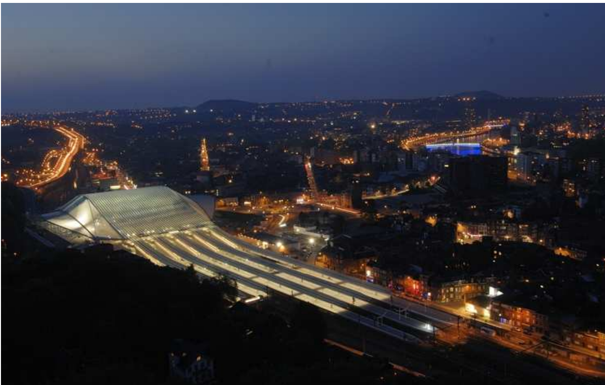
Nachtaufnahme vom Lütticher Bahnhof Guillemins