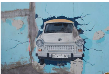
Mit dem Trabi durch die Mauer

Auch die Berliner East Side Gallery wurde anlässlich des 20. Jahrestages des Mauerfalls restauriert und soll am 10. November wieder eröffnet werden. 1990 hatten 118 Künstler aus 22 Ländern die Ostseite des 1,3 Kilometer langen Mauerstücks zwischen Oberbaumbrücke und Ostbahnhof bemalt. Als eine Sanierung notwendig wurde, versuchte man alle Künstler von damals zu finden, damit sie ihre ursprünglichen Werke nochmals malen konnten.