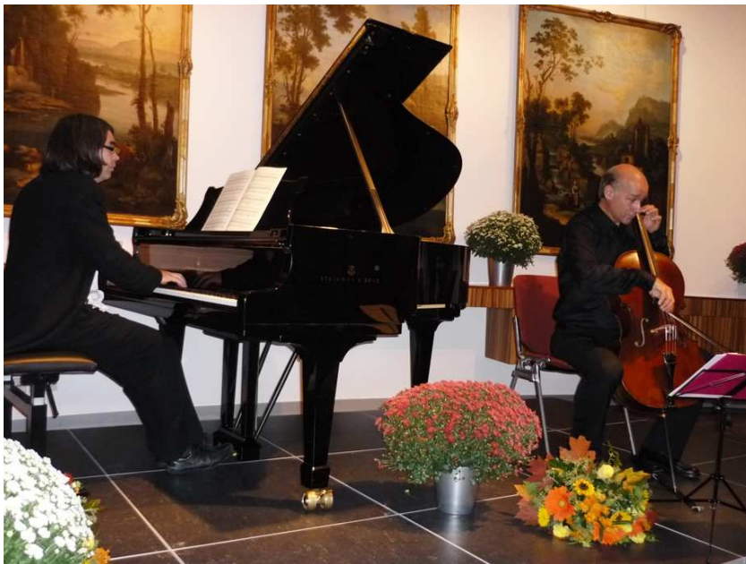
Ensemble Portici beim Konzert in der Belgischen Botschaft