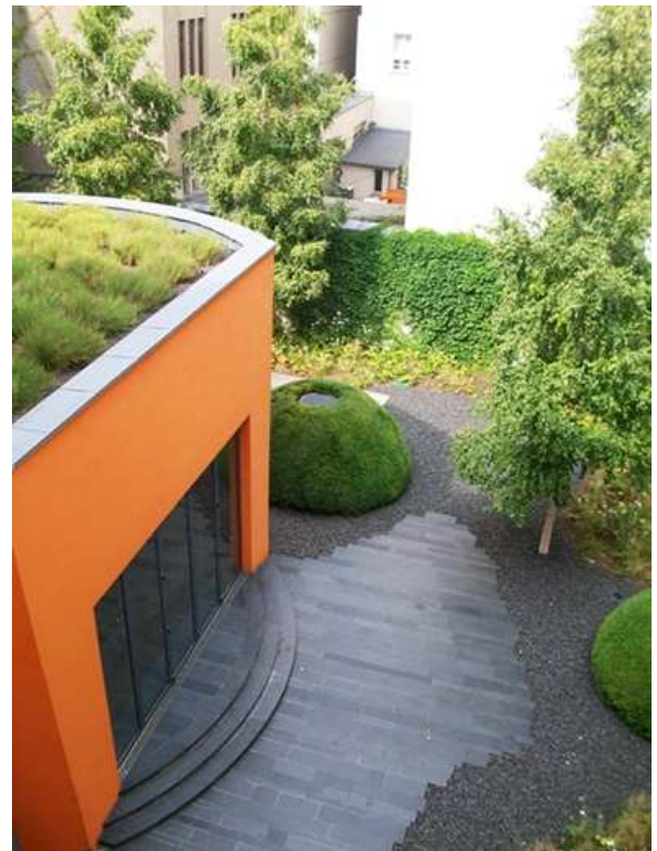
Ansicht des Gartens der Belgischen Botschaft mit dem begrüntem Dach des Veranstaltungssaals

Wussten Sie, welche deutsche Stadt auf Französisch Ratisbonne heißt und wie man in der Sprache Voltaires Mecklenburg-Vorpommern sagt? Wir beantworten Ihnen diese Fragen gerne