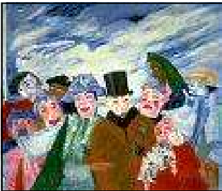
„Intrigue“ James Ensor

Momentan zeigt das Museum of Modern Art (MoMA) in New York eine Ausstellung, die dem belgischen Maler James Ensor gewidmet ist.