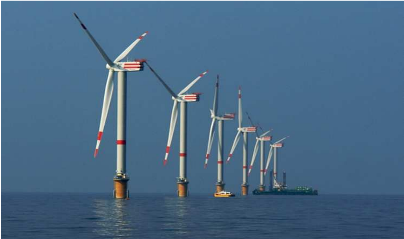
Offshore-Windpark „Thornton Bank“, 30 km vor der Küste von Ostende und Seebrügge