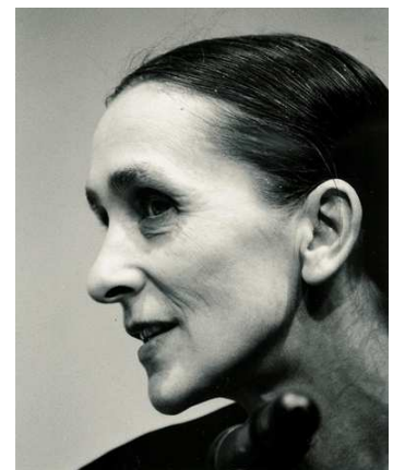
Pina Bausch