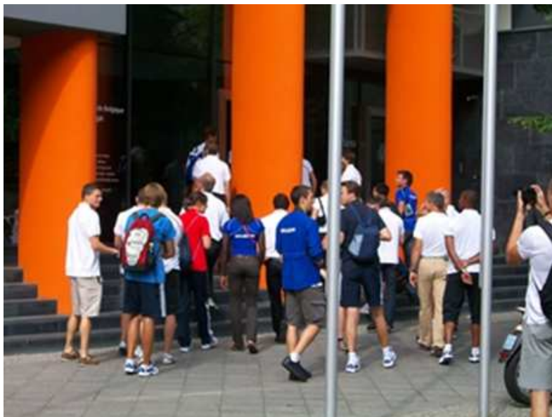
Die Athleten auf dem Weg in die Botschaft

Am 13. August 2009 wurden die belgischen Athleten, die an der Leichtathletik-Weltmeisterschaft in Berlin teilnahmen, in der Belgischen Botschaft empfangen. In seiner Rede dankte der Gesandte Bruno Angelet ihnen für ihr Kommen und sagte, dass er sich darüber bewusst sei, wie viel Disziplin und Training es erfordere, um an dieser Weltmeisterschaft teilnehmen zu können und sich mit den Besten der Welt zu messen.