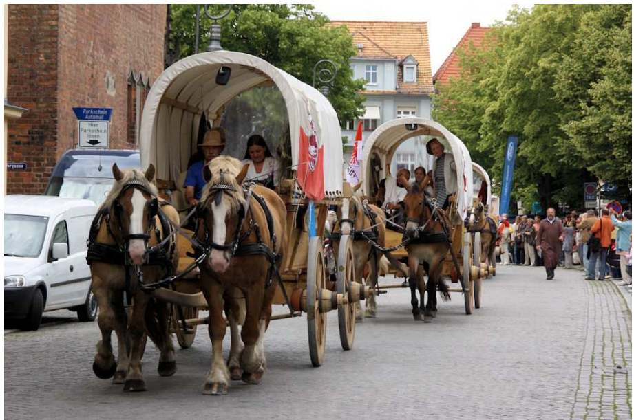
Die Planwagen wurden originalgetreu in Polen nachgebaut

Für viele Flamen, die von verheerenden Sturmfluten und Missernten heimgesucht worden waren, war dies eine Möglichkeit, ihr Glück im Osten zu versuchen. In langen Trecks verließen sie ihre Heimat und gründeten zahlreiche Siedlungen im heutigen Fläming. Sie waren wegen ihrer großen Erfahrung bei der Entwässerung von