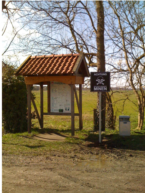
„Hazard Marking System“, 2006 Ives Maes „Achtung! Biologisch abbaubare Minen“