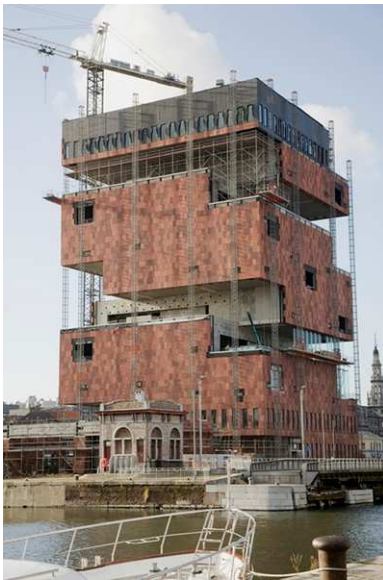
Museum am Strom (MAS)