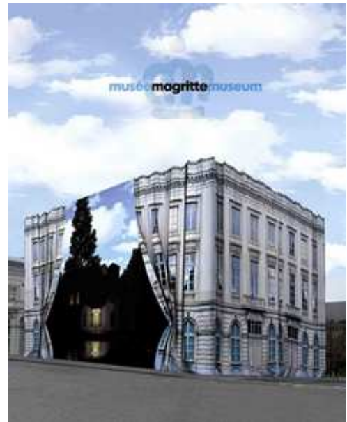
Banner mit Abbildung „J' Empire des Lumières“, 1954 © Charly HERSCOVICI, with his kind authorization – c/o SABAM-ADAGP, 2008 For the decorative tarpaulin © SUEZ

Das Museum, das vom bekannten französischen Architekten Christian de Portzamparc entworfen wurde, hat die Form eines lang gezogenen Prismas. Auf 3.600 m 2 Fläche wird den Besuchern das Leben und Werk des Erfinders der „ligne claire“