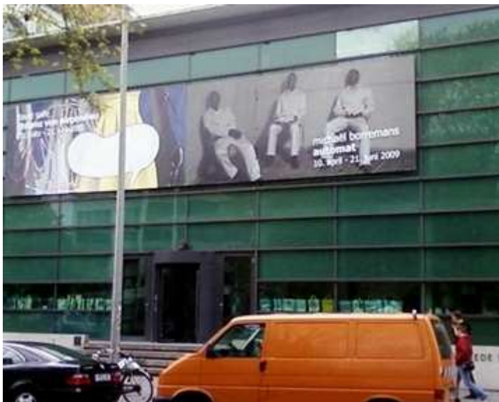
Vorderansicht der "kestnergesellschaft"

(Ostflandern) geboren. Der Künstler lebt und arbeitet in Gent.