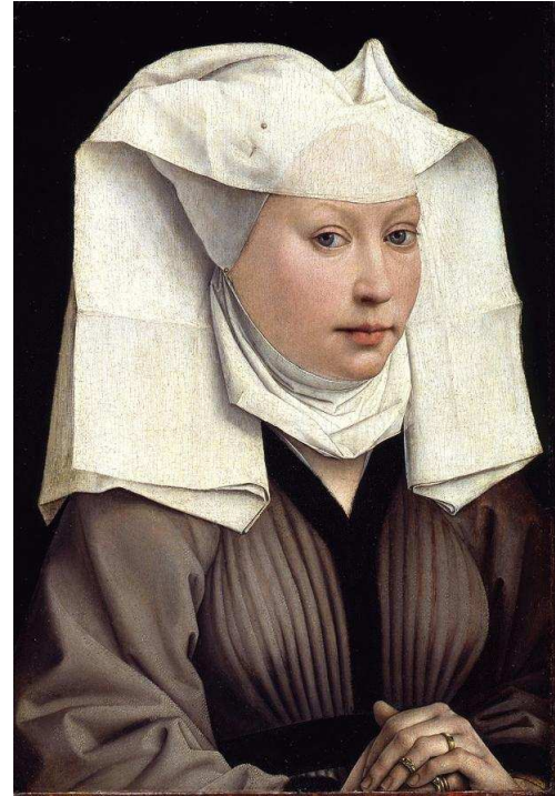
Rogier van der Weyden „Bildnis einer jungen Frau“ Eichenholz, 49,1 x 33 cm © Staatliche Museen zu Berlin, Gemäldegalerie;

und http://eid.belgium.be/nl/Welke_kaarten_/Kids-ID/ , http://eid.belgium.be/fr/Quelles_cartes/Kids-ID/index.jsp