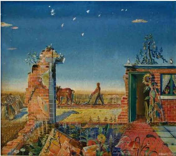
„Der zurückgekehrte Frieden“, 1950 entstanden