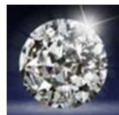
„Brilliant Lady“ ist ein Entwurf von Louis Verelst

Weitere Informationen finden Sie unter: www.brilliant-lady21.com